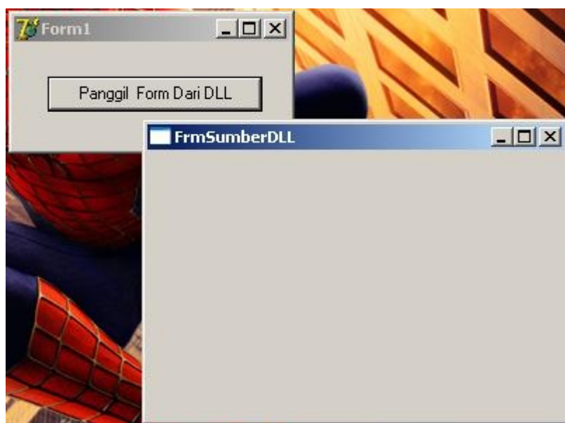
Gambar 5. Tes Pemanggilan Form dari file Dynamic NgatesDLL.dll

📖 Setelah itu coba anda jalankan/running dengan menekan tombol F9. kemudian tekan tombol “ Panggil Form dari DLL” Maka program akan menampilkan Form dengan memanggil fungsi Showmodal (DLL) pada file NgatesDLL.dll di file dynamic link library yang anda buat pertama kali.