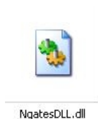
Gambar 3. File dll setelah di Build.

📖 Untuk membuat kode di atas menjadi file DLL pilih menu Project kemudian Build . kemudian lihat akan terbentuk file dengan nama NgatesDLL.dll