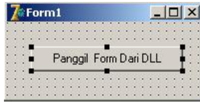
Gambar 4. Form untuk mengetes pemanggilan file ngates.DLL

📖 Kemudian double klik komponen button hingga muncul editor unit untuk event onClick dan isikan kode berikut: