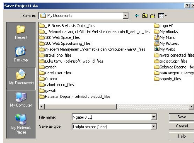
Gambar 1. Dialog Penyimpanan Project *.dll