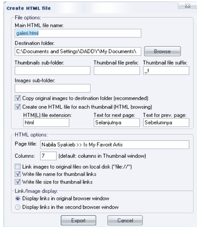
Gambar 1. Kotak dialog Create HTML file

Sekarang lihat di folder tempat kamu menyimpan file tadi, sekarang sudah terbentuk beberapa file dalam format html dan beberapa buah gambar. Cari File yang bernama 'galeri.html' dan buka menggunakan web browser kamu. Selamat!. kamu telah berhasil membuat album foto dengan cepat dan mudah.